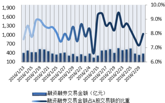
图1：近三十个交易日融资融券交易金额及占A股交易额的比重