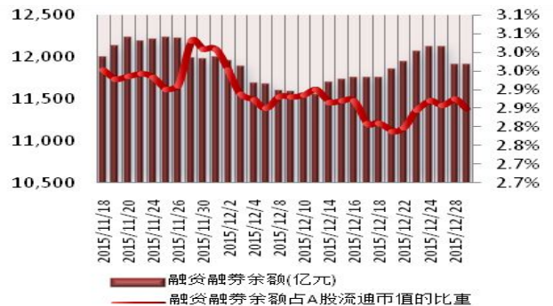
图 2：近三十个交易日融资融券余额及占 A 股流通市值的比重