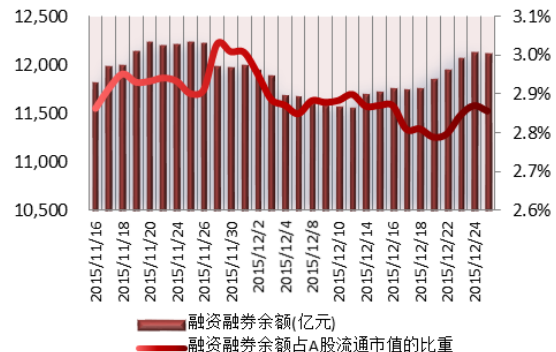
图 2：近三十个交易日融资融券余额及占 A 股流通市值的比重