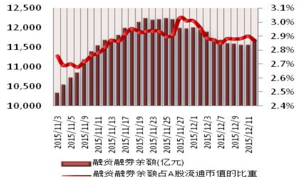
图 2：近三十个交易日融资融券余额及占 A 股流通市值的比重