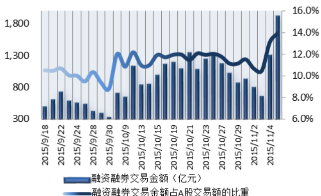
图1: 近三十个交易日融资融券交易金额及占A股交易额的比重