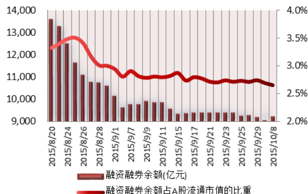
图 2: 近三十个交易日融资融券余额及占 A 股流通市值的比重