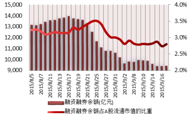
图 2: 近三十个交易日融资融券余额及占 A 股流通市值的比重